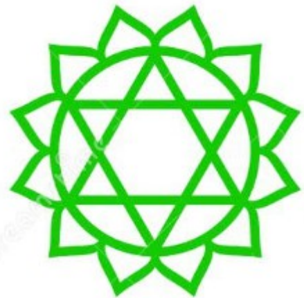
CHAKRA DU COEUR